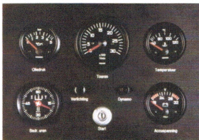
Afmeting: 210 mm. x 300 mm.